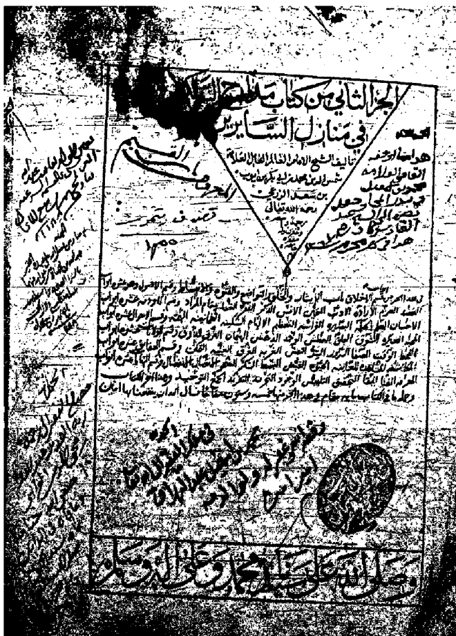
صفحة العنوان من النسخة التيمورية (ت)