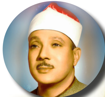
تحميل القرآن الكريم بصوت عبد الباسط

للإستماع وتحميل أكثر من (٨٣٠) مصحفاً كاملاً وما يزيد عن (١٣٣,٠٠٠) تلاوة