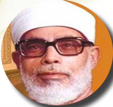
تحميل القرآن الكريم بصوت الحصري