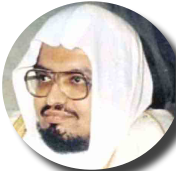
تحميل القرآن الكريم بصوت علي جابر