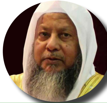
تحميل القرآن الكريم بصوت محمد أيوب

للإستماع وتحميل أكثر من (٨٣٠) مصحفاً كاملاً وما يزيد عن (١٣٣,٠٠٠) تلاوة