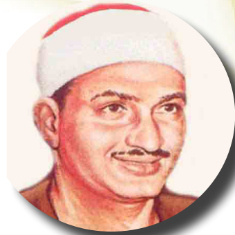
تحميل القرآن الكريم بصوت المنشاوي